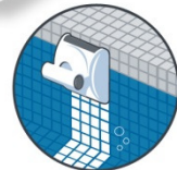
Reinigung der Wasserlinie