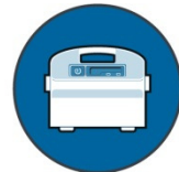
Anzeige des vollen Filterbeutels und Betriebsverzögerung